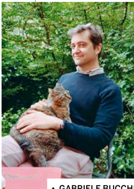
▲ GABRIELE BUCCHI

qualità e rinomanza: 57 tipi diversi, il cui elenco termina con il migliore di tutti, il celebre Montepulciano, proclamato "d'ogni vino il re!". Bacco canta le virtù di questi vini prestigiosi (Chianti, Trebbiano, Aleatico, Moscadello di Montalcino, Vernaccia di San Gimignano), descrivendone i profumi, i sapori e gli effetti piacevoli sull'animo umano, mentre disprezza i vini stranieri (come quelli francesi, tedeschi e spagnoli), considerandoli inferiori, e i vini di pianura del contado fiorentino. In tono vivace, ironico e spesso goliardico, l'autore rende omaggio alla terra di Toscana, e offre uno spaccato della società seicentesca e della vita di corte con i giochi, i balli, i rituali. La sua poesia, intrisa di riferimenti mitologici e simbolici, riflette l'amore di Redi per la natura e il vino, simbolo di convivialità, sottolineandone il ruolo centrale nelle feste e nelle celebrazioni. L'autore invita i lettori a godere dei piaceri della vita, del buon cibo e del buon vino, e ricorre a immagini vivide per descrivere i vigneti, le colline e la gioia della vendemmia, esprimendo un profondo apprezzamento per la bellezza paesaggistica: "Se dell'uve il sangue amabile non rinfranca ognor le vene, questa vita è troppo labile, troppo breve e sempre in pene. Si bel sangue è un raggio acceso di quel sol, che il ciel vedete; e rimase avvinto e preso di più grappoli alla rete."