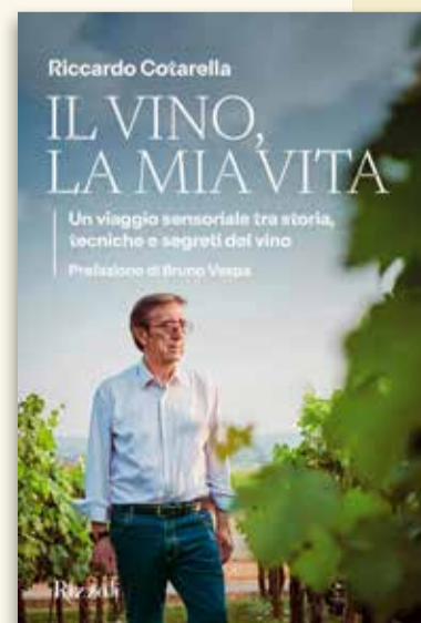
IL VINO, LA MIA VITA Un viaggio sensoriale tra storia, tecniche e segreti del vino di Riccardo Cotarella Rizzoli Libri Pagg.334 - € 28,50