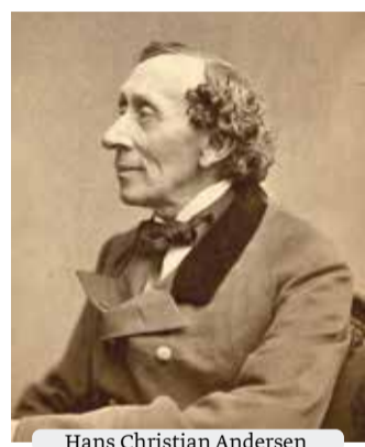
Hans Christian Andersen

Al caldo di un camino, tra la folla degli amici e dei parenti, tra doni e tavole addobbate a festa, si rincorrono sogno e incanto, allegria e mistero, perché come diceva Giovanni Verga in una novella: "Il Carnevale fallo con chi vuoi: Pasqua e Natale fallo con i tuoi". Anche un proverbio marchigiano sottolinea che occorre festeggiare il giorno più lieto e più caro dell'anno circondato dagli affetti familiari per scambiarsi gli auguri: "Carnevale dove ti trovi, Natale a casa tua se puoi". E si aggiunge: "A Natale, i vini è tutti uguale", ovvero il vino nuovo è uguale al vecchio rispetto all'essersi chiarito e al potersi bere. Nemmeno il favolista danese Hans Christian Andersen (1805 - 1875) resta immune al fascino di raccontare il vino, come sinonimo di festività e di so-