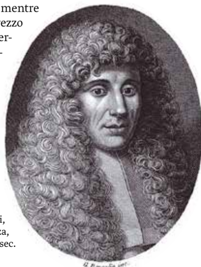
G. Benaglia, Francesco Redi, incisione, Musei Civici di Monza, XIX sec.

Pioniere nel campo della scienza, oggi è ancora studiato e rispettato. Le sue opere sono conservate in luoghi di cultura, tra cui la Biblioteca Medicea Laurenziana di Firenze che possiede manoscritti autografi, mentre nell'Accademia Petrarca di Arezzo è collocata la sua biblioteca personale. La Biblioteca Internazionale "La Vigna" di Vicenza, dotata di un ricco patrimonio librario, con particolare attenzione all'enologia e alla viticoltura, possiede ad oggi ben 63 edizioni del "Bacco in Toscana", rispetto alle 82 conosciute.