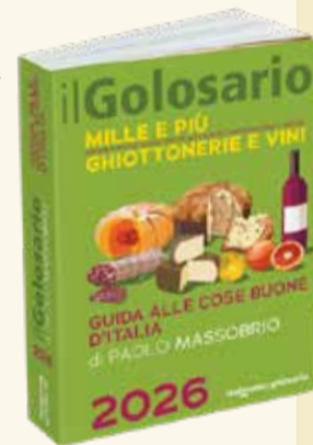
Guida alle cose buone d'Italia 2026 di Paolo Massobrio Il Golosario e Golosaria pagg. 928 - € 28,00

La Guida alle cose buone d'Italia giunta alla sua 27ª edizione, si conferma come uno dei più autorevoli riferimenti per chi ama viaggiare alla scoperta delle eccellenze enogastronomiche italiane. Frutto delle instancabili esplorazioni di Paolo Massobrio e della sua squadra, questa guida raccoglie il meglio della produzione alimentare artigianale, raccontata regione per regione, da Nord a Sud. Oltre 10.000 segnalazioni tra produttori di qualità, botteghe del gusto, negozi specializzati e cantine con i loro vini più rappresentativi - con 90 nuovi produttori recensiti, 177 nuovi negozi e oltre 150 nuove cantine in questa edizione - per un viaggio unico tra sapori autentici e storie di territorio che si conferma la bussola del gusto italiano. Un viaggio che ha generato la fiera Golosaria, richiamata prima, che è diventata un luogo di incontro ideale, ogni anno a Milano, fra produttori artigianali di qualità, botteghe che portano questa qualità e cantine: la manifestazione vivente di questo libro, frutto di continue ricerche appassionate, sondando i paesi, le città, alla ricerca di artigiani che portano il gusto italiano nella sfera della contemporaneità.