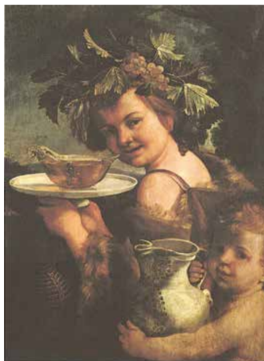
Guido Reni (Bologna, 1575-1642) Bacco fanciullo, tela, 87x70 Firenze, Galleria Palatina

F igura cardine nella storia della scienza, Francesco Redi è noto per i suoi studi e i suoi esperimenti nell'ambito della biologia e della medicina, che non solo hanno influenzato il secolo XVII, ma hanno segnato una svolta epocale sulla comprensione dell'origine degli organismi viventi. Autore di diverse opere scientifiche, il gentiluomo aretino visse principalmente a Firenze, dove fece carriera e svolse la professione di medico alla corte del Granduca di Toscana. Tuttavia, colui che può essere considerato il padre della biologia sperimentale coltivò anche un animo poetico, riuscendo a coniugare l'amore per la scienza e la sua sensibilità artistica, attraverso la pubblicazione di "Bacco in Toscana", un testo, caratterizzato da uno stile musicale e allegro, che ci offre un'interessante panoramica sull'enologia del tempo. Il componimento, elogiativo dei vini toscani, stabilisce che il Montepulciano "d'ogni vino è re".