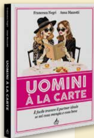
UOMINI A LA CARTE di Francesca Negri e Anna Mazzotti Leonardo J. Edizioni Pagg. 140 - € 19,90