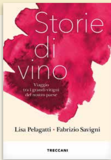
STORIE DI VINO - Viaggio tra i grandi vitigni del nostro Paese di Lisa Pelagatti e Fabrizio Savigni Treccani Libri pagg.176 - € 18,00