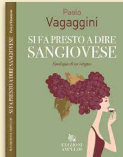
SI FA PRESTO A DIRE SANGIOVESE di Paolo Vagaggini Edizioni Ampelos Pagg. 208 - € 25,00

al mondo esiste una biodiversità viticola così vasta come quella del nostro paese - scrivono gli autori - oltre mille vitigni autoctoni, con molti altri che stanno tornando alla luce grazie al lavoro appassionato di viticoltori innamorati della propria terra. Nebbiolo, Montepulciano, Sangiovese, Glera, Barbera, Trebbiano, Pignoletto, Malvasia... Per molto tempo questa ricchezza è stata considerata un problema: negli anni dell'agricoltura industriale, dell'enoologia standardizzata e delle classifiche si cercavano varietà "internazionali" valide per ogni clima e ogni mercato. Eppure, da qualche tempo qualcosa è cambiato. Oggi la sfida è diventata "difendere un modello culturale, perché un vino nasce dalla terra, dalle parole che usiamo per descriverlo. Questo viaggio attraverso le vigne d'Italia - concludono gli autori - lascia un'impressione profonda: la grandezza del vino italiano sta nella sua molteplicità. Ogni collina, ogni valle, ogni isola ha dato vita a una voce diversa. Ogni bottiglia è non solo vino, ma atto di resistenza culturale. E allora il nostro compito non è solo bere o produrre vino, ma ricordare i nomi. Perché ogni vite ha un nome. E ogni nome è una storia da raccontare".