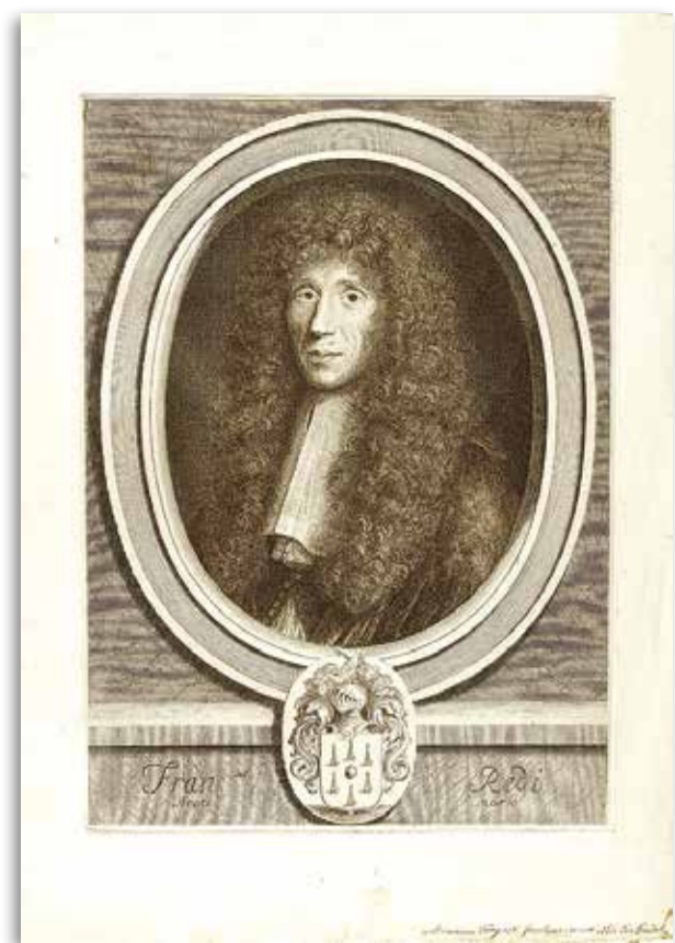
Ritratto di Francesco Redi