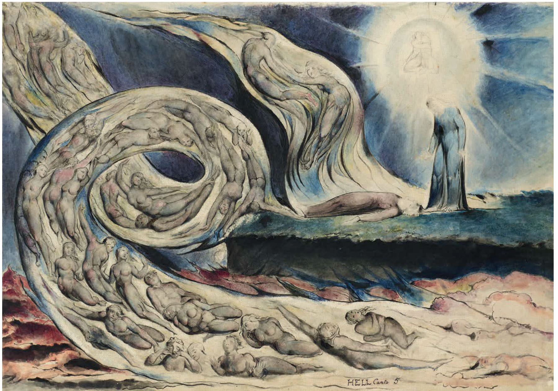
De tweede hellecirkel: de wellustigen worden in een razende stormwind eeuwig voortgesleurd. Dante gaat in gesprek met zijn tijdgenoten Francesca da Rimini en Paolo Malatesta: hij is zo ontdaan dat hij het bewustzijn verliest.