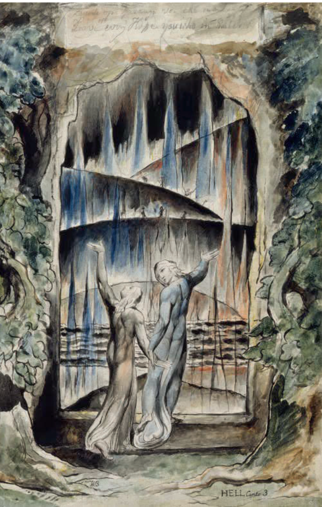
De ingang van de hel, met bovenaan het beroemde opschrift: 'Laat varen alle hoop, gij die hier binnentreedt.'