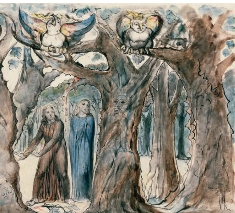
De zevende hellecirkel: de zielen van de zelfmoordenaars zitten opgesloten in kale bomen en worden geplaagd door afschrikwekkende harpijen. Als je een tak afbreekt, gaan ze bloeden.